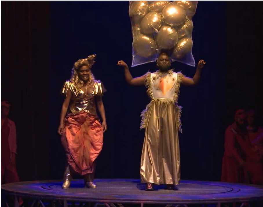
filmstill uit Trojan Wars

Dit jaar hebben 509 kandidaten het examen uit het eerste tijdvak drama vmbo gemaakt. In het examen stonden twee theatervoorstellingen centraal: Back to Oz (van Het Filiaal theatermakers in samenwerking met K.O.Brass en Slagwerk Den Haag) en Trojan Wars (van Het Nationale Theater). Ook maakten de eindexamenkandidaten kennis met de Netflixserie Undercover .