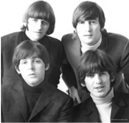
De haarstijl van The Beatles (rond 1964)

Dat muziek van alle tijden is, en jong en oud raakt, blijkt uit de reacties van leerlingen op het centraal schriftelijk examen kunst (algemeen) 2024-1. “Ik heb op de fiets ook net huilend keihard meegezongen met Therefore I Am van Billie Eilish, omdat dat hopelijk echt de vraag is waar ik sowieso alle punten ga scoren” was te lezen op de site van Scholieren.com. Hair , The Beatles, David Bowie en Billie Eilish passeerden in dit examen onder meer de revue, waarbij leerlingen net zo enthousiast leken te zijn over de jaren 70 musical Hair als over het hedendaagse popnummer van Eilish. Deze muziekstukken en -artiesten zijn door de examenmakers onder meer gekozen vanwege hun (uitingen van de eigen) identiteit. Zo stonden The Beatles bekend vanwege hun vooruitstrevende kapsels, lieten de hippies in Hair hun haren groeien om zich af te zetten tegen de gevestigde orde, speelde Bowie met gender in zijn uiterlijk en probeerde Eilish met haar kledingstijl vooral trouw te blijven aan zichzelf. Het is geen verrassing dat identiteit het thema was van dit examen en als rode draad door de periodes hofcultuur, cultuur van het moderne en de massacultuur liep. Zo’n 6114 kandidaten gingen hiermee op 22 mei aan de slag en mochten niet alleen hun tanden zetten in muziek, maar ook in dans, drama, film en beeldende kunst.