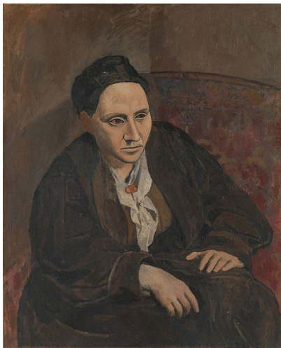
Pablo Picasso, Gertrude Stein , 1905-06

Blok 2 ging over de 'nieuwe vrouw' aan het begin van de twintigste eeuw, en over de Duits-Amerikaanse zangeres en actrice Marlene Dietrich (1901-1992). Vraag 11 vertelde over de Amerikaanse schrijfster en mecenas Gertrude Stein die zich begin twintigste eeuw liet portretteren door Pablo Picasso. Dit portret sloot aan bij het nieuwe beeld van de vrouw rond 1900, met een ander schoonheidsideaal mede ingezet door de eerste feministische golf. Deze vraag bleek een struikelblok te zijn voor de minder vaardige leerlingen. Wellicht hadden zij moeite om het begrip 'nieuwe vrouw' te verbinden met theorieën over de eerste feministische golf. Vaardige leerlingen daarentegen konden deze verbinding wel maken, waardoor vraag 11 de meest onderscheidende vraag van het examen was.