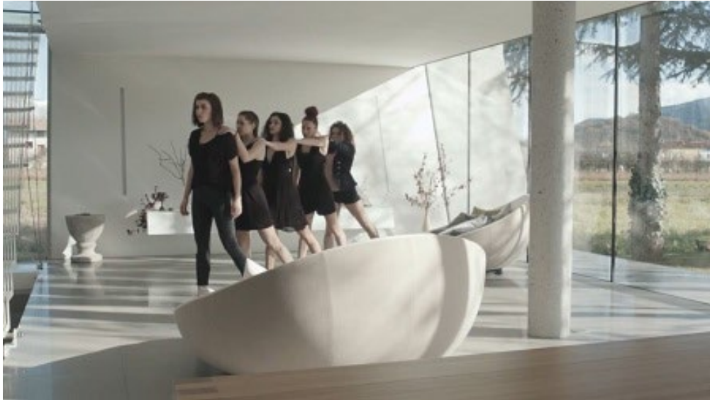
Room with a view

In het eerste blok werden vragen gesteld over de dansfilm Room with a view , gemaakt in 2015 door het Sloveense gezelschap MN Dance Company. Deze korte film is gebaseerd op de gelijknamige choreografie die het gezelschap een jaar eerder in de theaters opvoerde. In de dansfilm zijn elementen uit deze choreografie overgenomen en aangepast aan de bijzondere locatie van de filmopname; een designwoning. Deze remake bood de examenmakers de gelegenheid om vragen te stellen over de relatie tussen de choreografie en de locatie, én in te gaan op overeenkomsten en verschillen tussen de theaterversie en de filmversie. Zo moesten de kandidaten bij vraag 3 uit vier gegeven vloerpatronen de juiste weergaven herkennen van respectievelijk het fragment uit de dansfilm en het fragment uit de theaterversie. Dit bleek een redelijk lastige opgave te zijn.